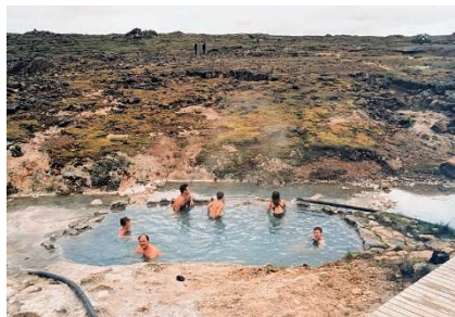
ieder dorpje heeft wel een hotpot