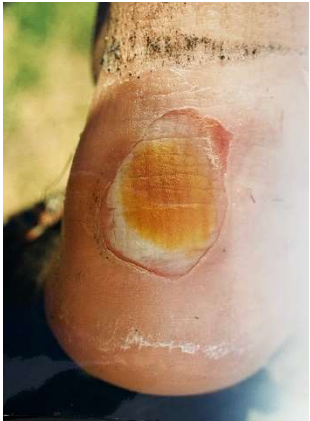
De hiel van Hetty (pijnlijk)