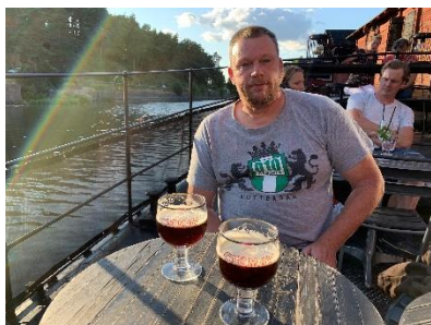
Aan een lekker biertje