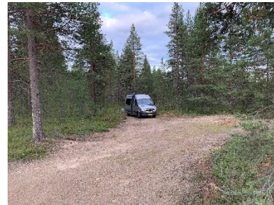
Ons plekje voor de nacht

In de buurt van Perttaus zijn we weer gestopt en hebben een leuk plekje voor de nacht gevonden.