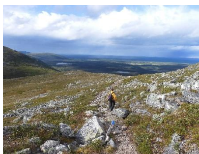
De 7 km lange wandeling