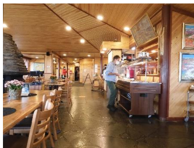
Eten op de Kaunispää