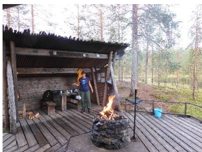
Een lekker vuurtje maken bij de hut