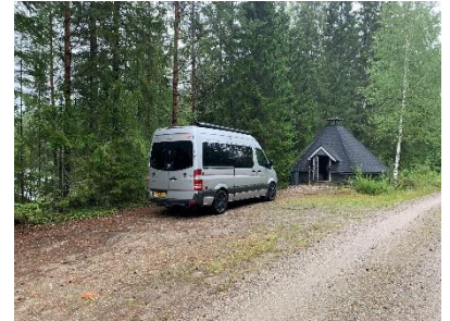
Lekker binnen kunnen koken

Vandaag een echte rijdag, mede omdat het de gehele dag regende. We hebben een leuk plekje gevonden voor de nacht bij een hut. Hier konden we lekker binnen droog koken.