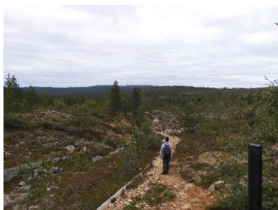
Wandeling in het Nationale Park

We hebben hier in het restaurant lekker gegeten. Daarna zijn we weer terug gelopen naar Saariselkä en hebben nog wat gedronken in diverse gelegenheden (net zoals de Finnen doen).