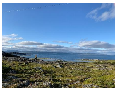
Mooi uitzicht op de fjord