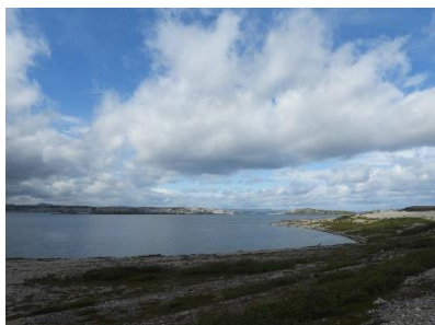
Langs de 98 net voorbij Lakselv

Bij Slettnes fyr stormde het heel erg, een heel mooi gezicht, maar koken buiten was wel een uitdaging.