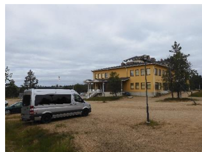
Onze overnachtingsplek in het dorp

Gelukkig was Panimo en O'Porro wel open en we moesten wel eten bij Teerenpesä, want het restaurant van Tunturi was dicht.