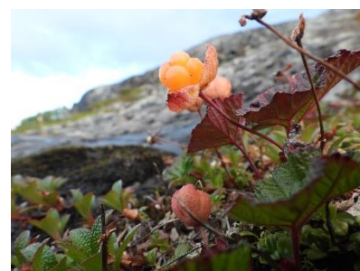
Rijpe hilla (bergbraambes)