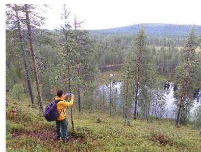
Geocachen in Syote