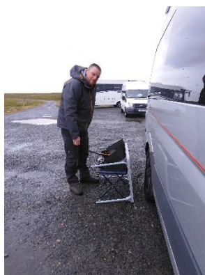
Buiten koken met hard wind