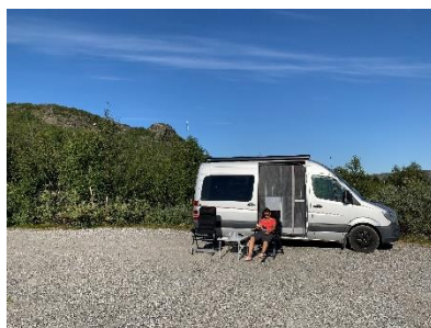
Een middagje relaxen in de zon