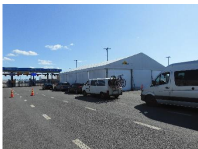
De incheckbalie in Vuosaari

We hebben vanmorgen rustig alles ingepakt in de bus en zijn toen naar Vuosaari gereden om daar de Finnlines naar Travemünde te nemen.