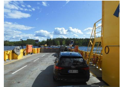
Onderweg ook nog een pontje over een meer

We hebben vandaag in het zuiden de Russische grens nog een stukje gevolgd, want we waren hier nog nooit geweest. We zijn een klein zijweggetje ingereden en kwamen in de buurt van het plaatsje Vilala een leuk plekje in een stuk bos tegen. Hier hebben we 's avonds een leuk vuurtje kunnen maken.