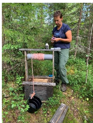
Leuke caches langs een doodlopende weg.

Vanaf de parkeerplaats van de wandeling zijn we naar het Visitor Centre van Syote NP gereden. Hier hebben we een andere (nieuwe) wandeling gedaan, die ook weer een aantal geocaches bevatte. Daarna hebben we een lekkere soep gegeten in het Visitor Centre en zijn daarna weer verder gegaan op onze tocht richting het zuiden. Onderweg nog een paar heel leuke caches gedaan op een doodlopende weg, waar alle bomen omgewaaid waren. We kwamen uiteindelijk uit voor de nacht bij de parkeerplaats naast een klein riviertje.