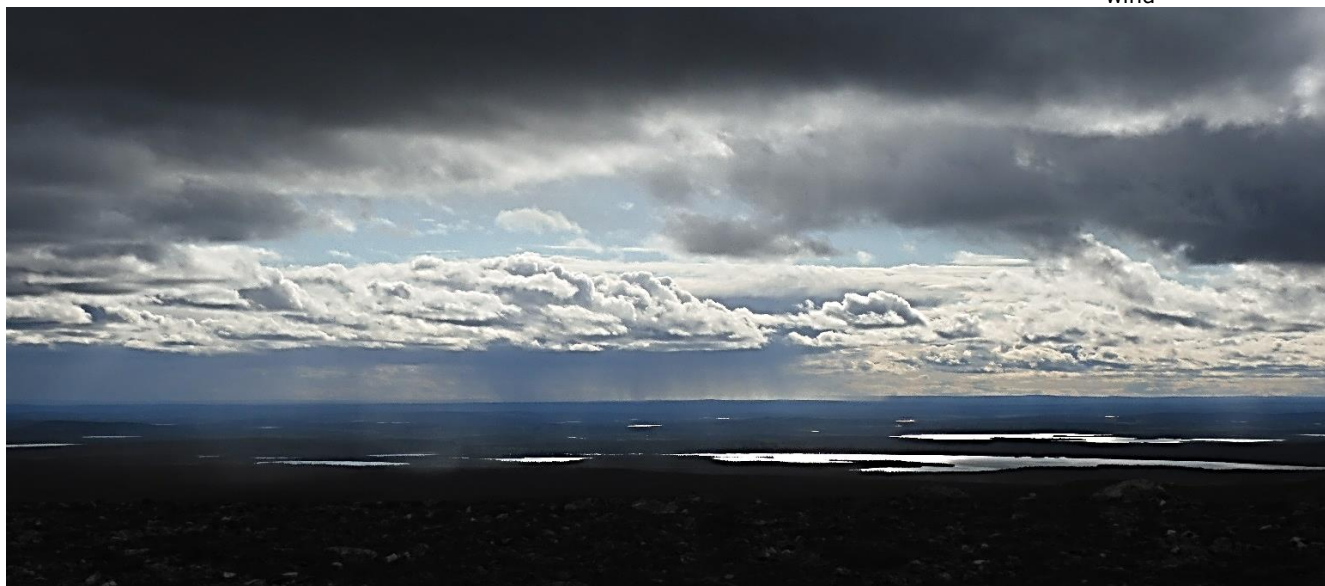
Uitzicht vanaf het hoogste punt van de Palkaskeronkierros wandeling