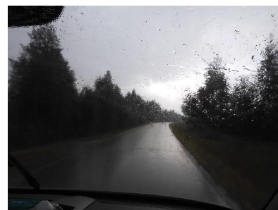
Af -en toe een flinke bui

De route ging verder via Rovaniemi naar het Syote NP. Hier zijn we bij Kollarilampi gestopt. We hebben de bus op de parkeerplaats van deze korte wandeling gezet. En zijn naar de hut gelopen. Hier hebben we een leuk vuurtje gemaakt en hebben worstjes geroosterd. Daarna hebben we nog een wandeling gedaan naar een aantal geocaches