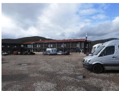
De bus bij het hotel geparkeerd