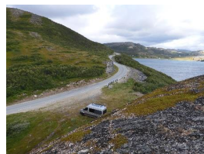
Ons plekje voor de nacht