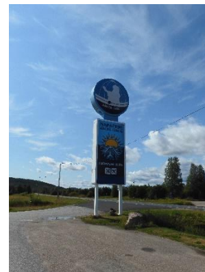
Het passeren van de poolcirkel

's Avonds zijn we naar de grote parkeerplaats gereden, die een paar honderd meter van het hotel ligt om hier te overnachten.