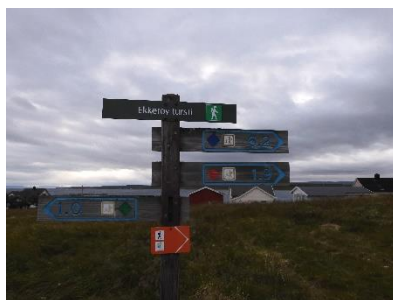
De blauwe wandeling gedaan