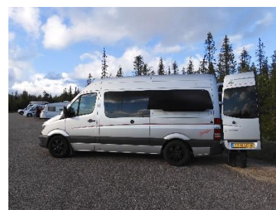
Koken achter de bus ivm de harde wind