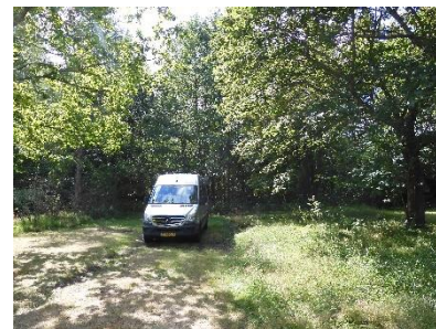
De camping in Porvoo

We zijn vandaag door gereden naar Porvoo. Nadat we weer voor het eerst sinds ruim 2 weken op een camping stonden, zijn we naar het oude centrum van deze stad gelopen. Hier zijn we in het oude centrum naar een leuk restaurant gegaan en daarna hebben we nog een paar (Belgische) biertjes en shots gedronken in een paar café's.