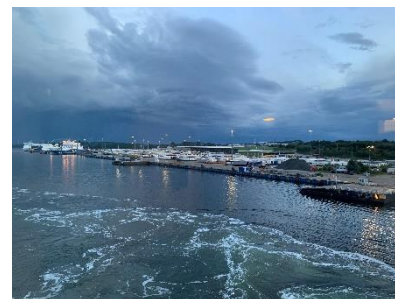
Aankomst in Travemünde