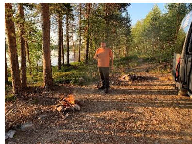
Een lekker vuurtje

We hebben 's avonds een lekker vuurtje gemaakt en we hebben ook nog in het meer gezwommen.