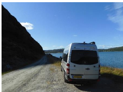
Een zijweggetje richting Vagge

Vanaf ons plaatsje zijn we vandaag verder gereden naar Bugøynes (het schijnt de hoofdstad van de king crab te zijn) en daarna zijn we via de E6 diverse zijweggetjes ingereden.