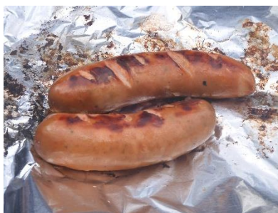
Lekkere geroosterde worstjes