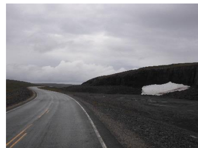
Langs de 888 richting Mehamn