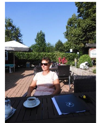
Relaxen na de lange rit op het terras