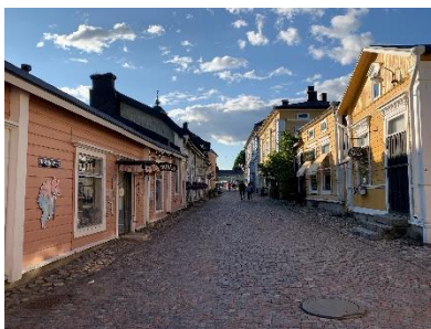
Een straatje in oud Porvoo