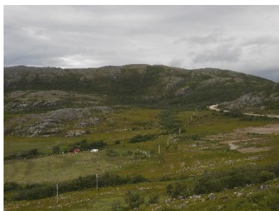
Ook langs de 98