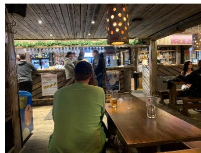
In de kroeg