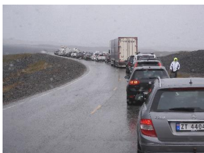
In de file voor een ongeluk