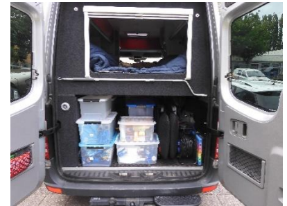
De bus netjes ingepakt

Ik was vandaag al vrij en kon de bus rustig inpakken. Ik zou Hetty op haar werk in Rotterdam ophalen en daarna zouden we naar Otterlo rijden om alvast een stukje onderweg te zijn. Om 17:30 uur reden we uit Rotterdam weg en we zaten om 19:30 uur al op het terras bij de Walthoorn in Otterlo om een hapje te eten.