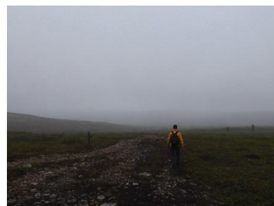
Veel miezer op de berg

Na het wandelen hebben we een douche genomen (€3/pp) bij Suomen Latu Kiilopää en hebben we hier gegeten in het restaurant. Daarna zijn we teruggereden naar Saariselkä en hebben 's avonds ons gebruikelijke rondje gedaan.