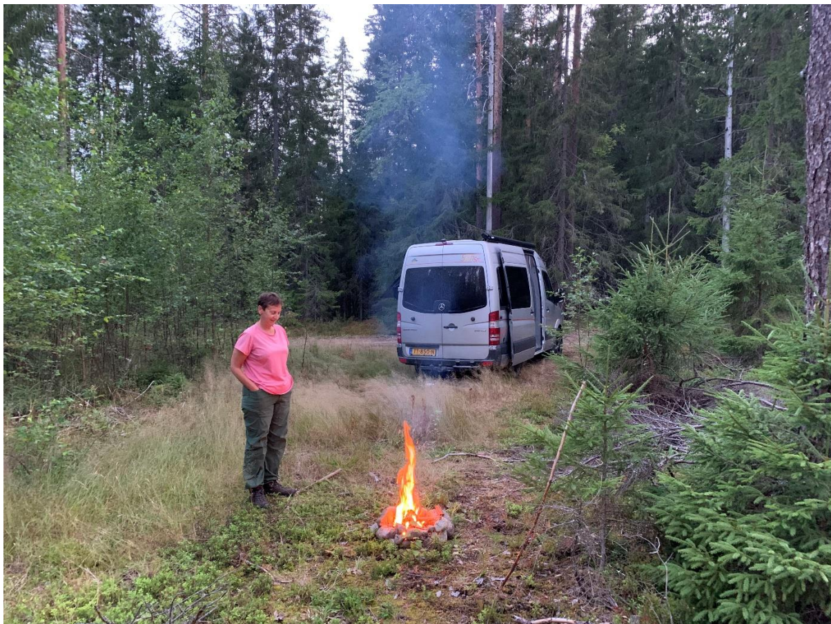
's Avonds nog een lekker vuurtje gemaakt