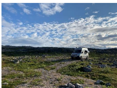
Onze mooie plekje

We hadden een heel mooi uitzicht en tijdens een wandelig kwamen we erachter dat hier de hilla (bergbraambes) al op een paar plaatsen rijp was. Dat hadden we deze vakantie nog niet gezien.