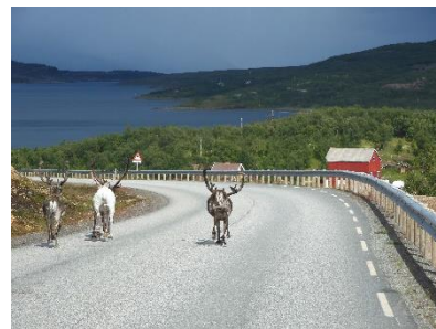
Het grootste gevaar op de weg

Daarna zijn we de nieuwe brug over gegaan en zijn richting Hamningberg gereden. Hier wilden we vorig jaar al heen, maar door de coronamaatregelen moesten we toen eerder in Finland terug zijn. We zijn heel veel gestopt onderweg om en zijn uiteindelijk bij Ekkerøy gestopt. Hier hebben we een leuke wandeling door het vogelreservaat gemaakt.